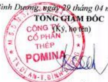
ĐỖ TIẾN SĨ